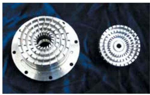
高剪切均质乳化机不同功能的定子头